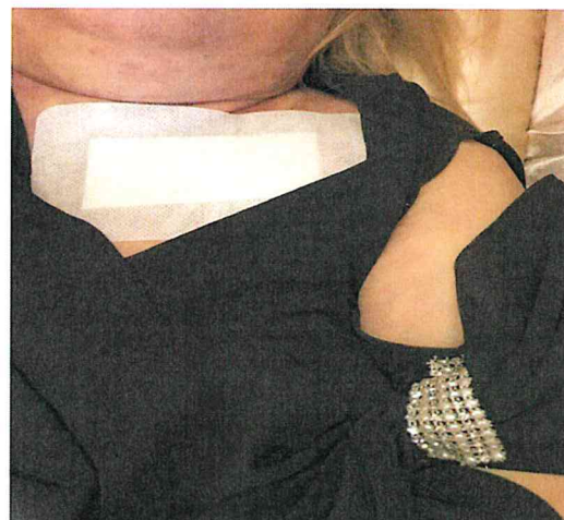
Fig. 1H - 2H

Applicare un cerotto adesivo sulla sede dell'incisione